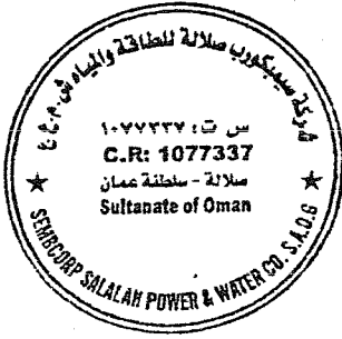
Legal Adviser المستشار القانوني